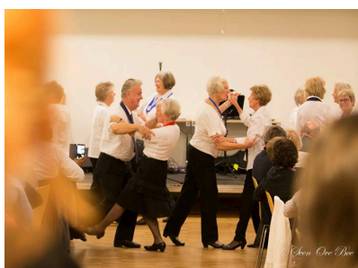
Juleball for eldre 2013