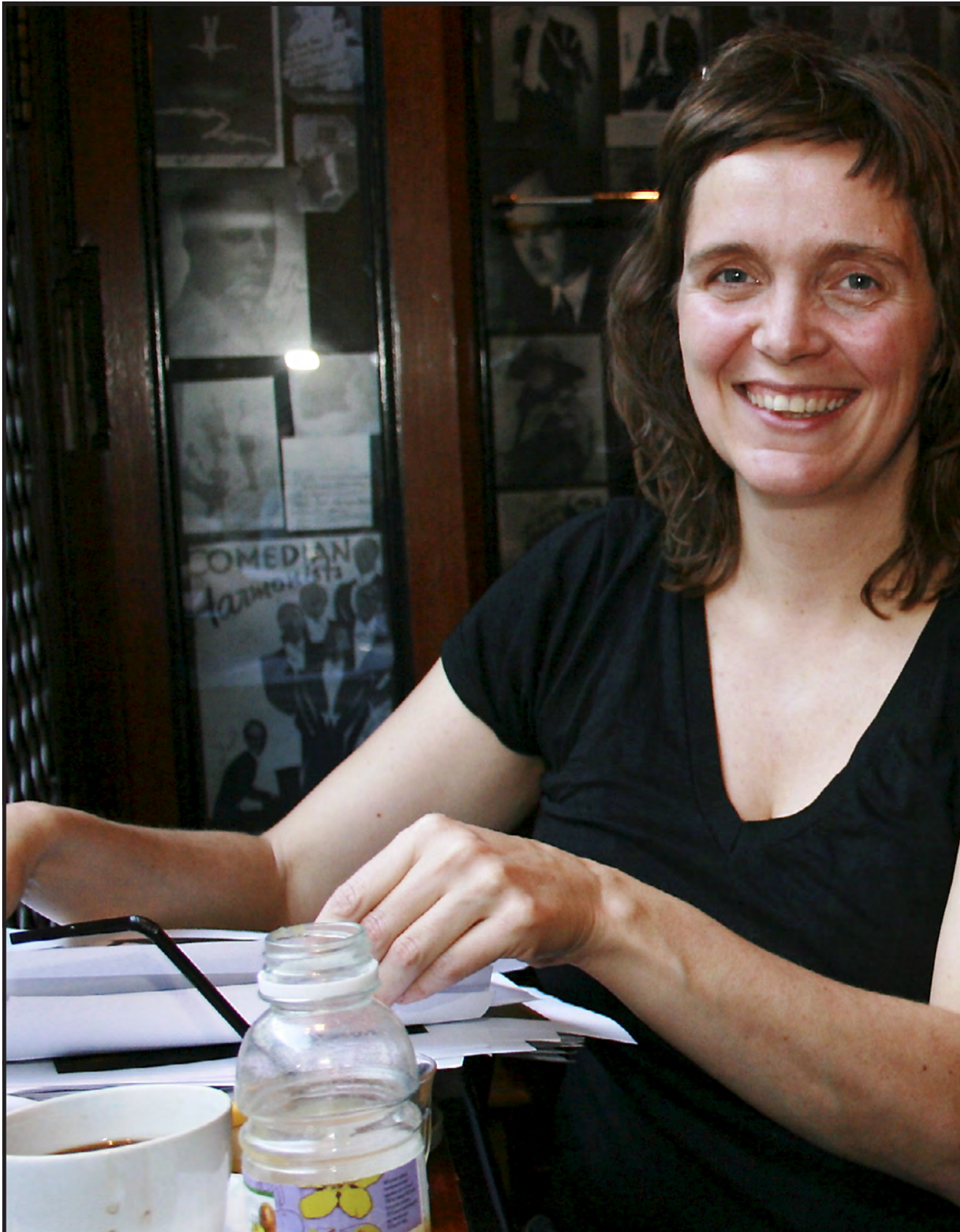
MAT OG FOLK: – Dette er ikke bare en kokebok med oppskrifter. Det er snakk om å få frem personer, kultur og tradisjoner gjennom ekte m